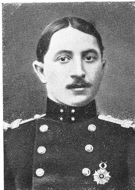
DAMSEAUX, André, né le 14 décembre 1890, à Nivelles.

Officier d'avenir trouva la mort des braves en combattant l'envahisseur, à la tête de ses hommes, le 21 août 1914, à Boninnes.