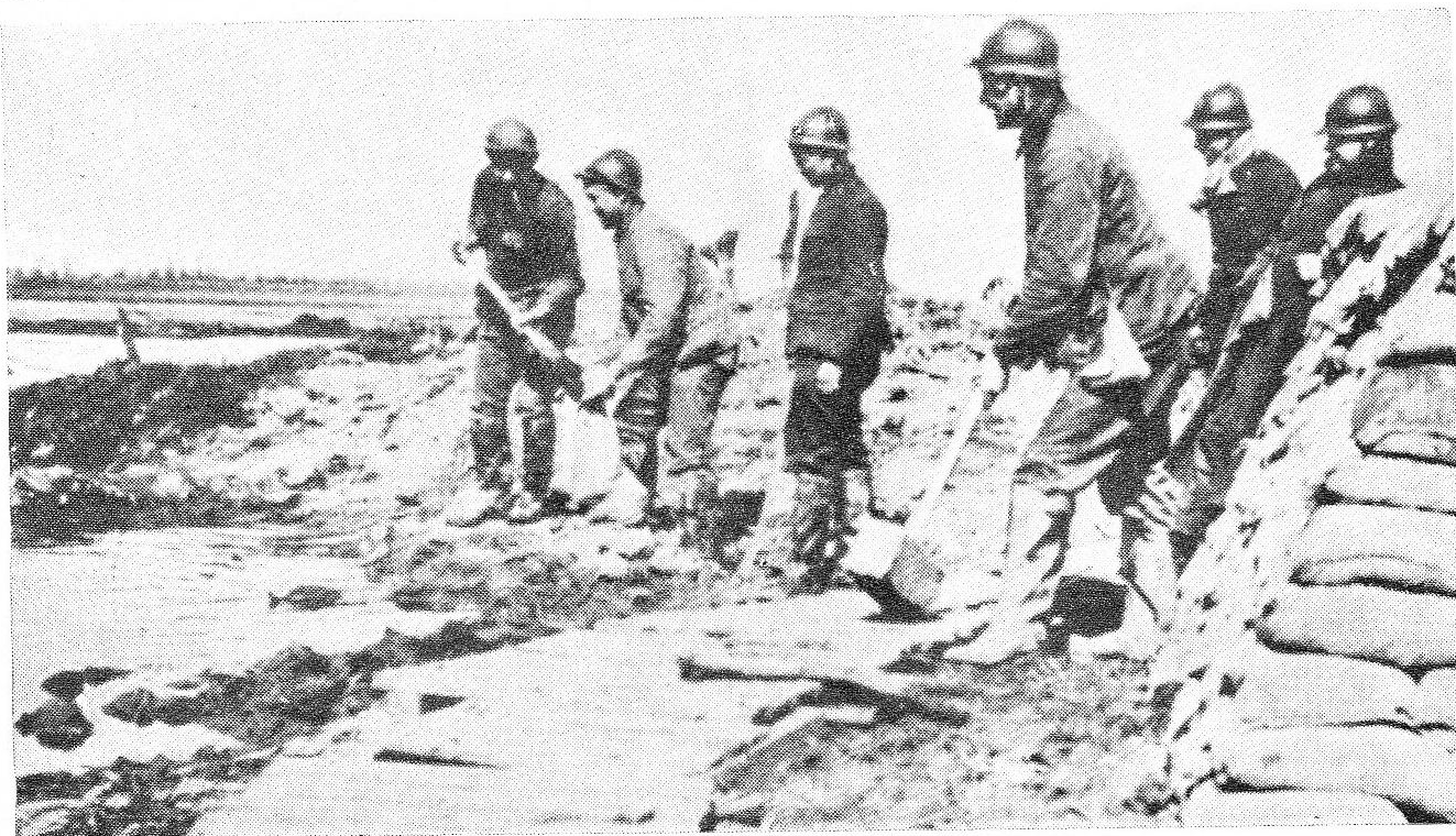
Travailleurs près de la Maison du passeur, à Noordschoote,